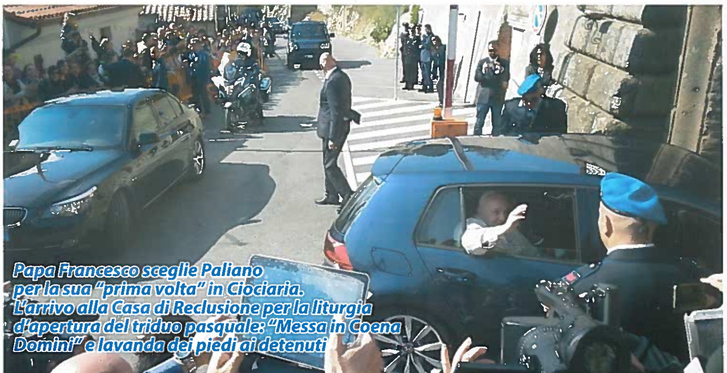
Papa Francesco sceglie Paliano per la sua "prima volta" in Ciociaria. L'arrivo alla Casa di Reclusione per la liturgia d'apertura del triduo pasquale: "Messa in Coena Domini" e lavanda dei piedi ai detenuti

Ad accogliere il Pontefice, al riparo delle mura interne della struttura, la direttrice Nadia Cersosimo e il cappellano don Luigi Paoletti. (segue a pag. 2)