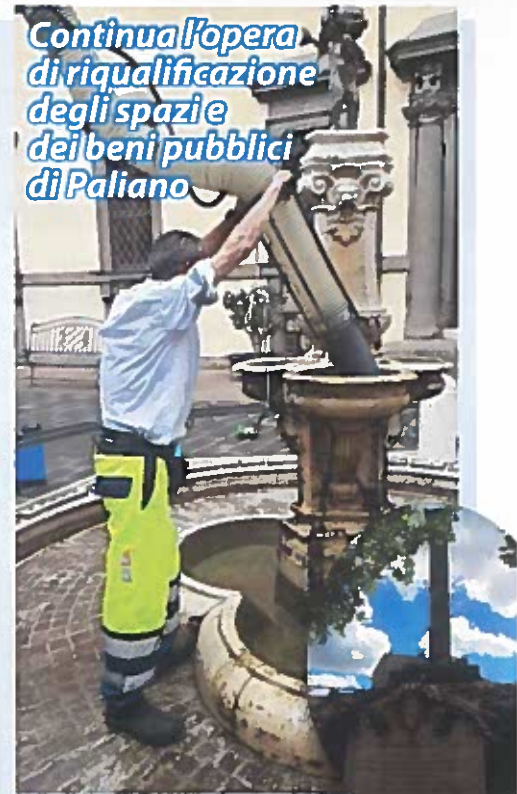
Continua l'opera di riqualificazione degli spazi e dei beni pubblici di Paliano

stradale è un elemento imprescindibile per garantire sicurezza e qualità urbana. Un impegno che abbiamo sostenuto con forza all'interno del consiglio provinciale e che ci ha permesso di ottenere i fondi necessari alla realizzazione di questi lavori: dopo la sistemazione di via Porta Sabauda nel 2015 e gli interventi del luglio 2016 sempre su via Palianese Sud siamo così riusciti a rinnovare gli ingressi e la strada principale del paese. Per chiudere il cerchio, nelle prossime settimane sarà rinnovato anche il manto stradale di via delle Valli, un'arteria di collegamento fondamentale tra via Palianese Sud e via Prenestina».