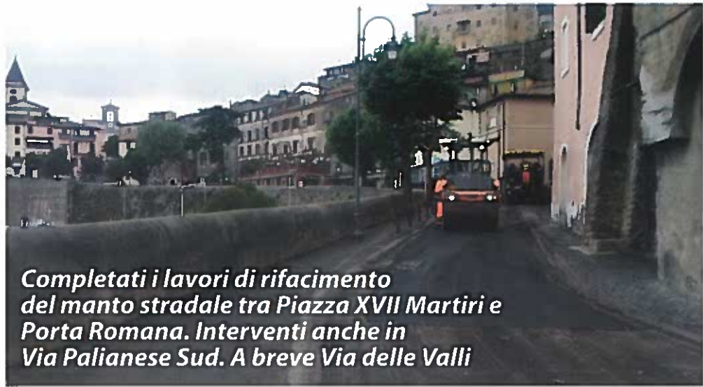
Completati i lavori di rifacimento del manto stradale tra Piazza XVII Martiri e Porta Romana. Interventi anche in Via Palianese Sud. A breve Via delle Valli