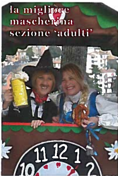
la migliore mascherina sezione 'adulti'