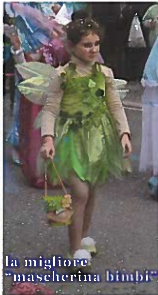
la migliore "mascherina bimbi"