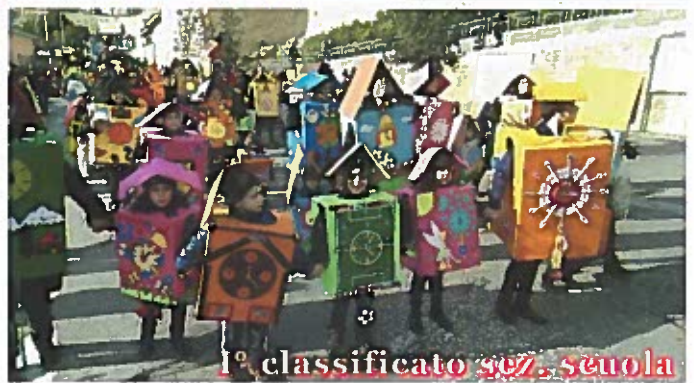
I° classificato sez. scuola