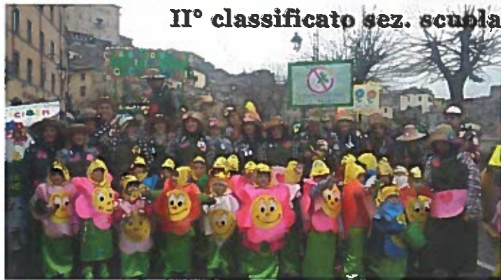
II° classificato sez. scuola