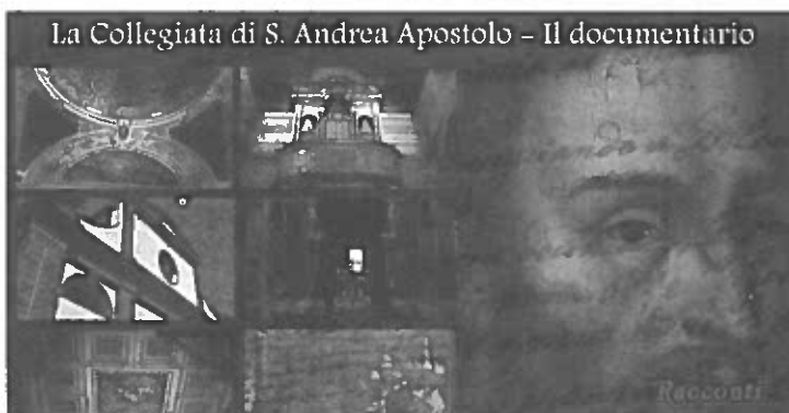
La Collegiata di S. Andrea Apostolo - Il documentario