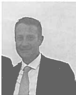
Il Sindaco Alfieri

locali periferici dalle enormi potenzialità, favorendo un maggiore sviluppo sociale, formativo ed economico delle nostre risorse. Tanti giovani avranno la possibilità di proseguire negli studi potendo contare su un'offerta didattica più completa e accessibile grazie alla contiguità territoriale. Ma soprattutto, i ragazzi potranno contare su un istituto che fornisce una